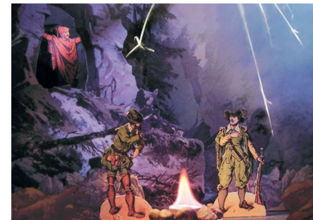
Invisius: Der Freischütz