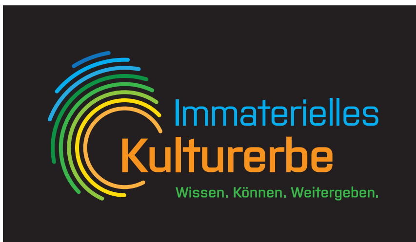
Signet farbig negativ