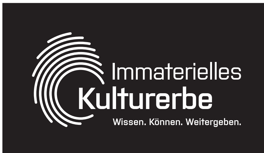
Signet Strich negativ