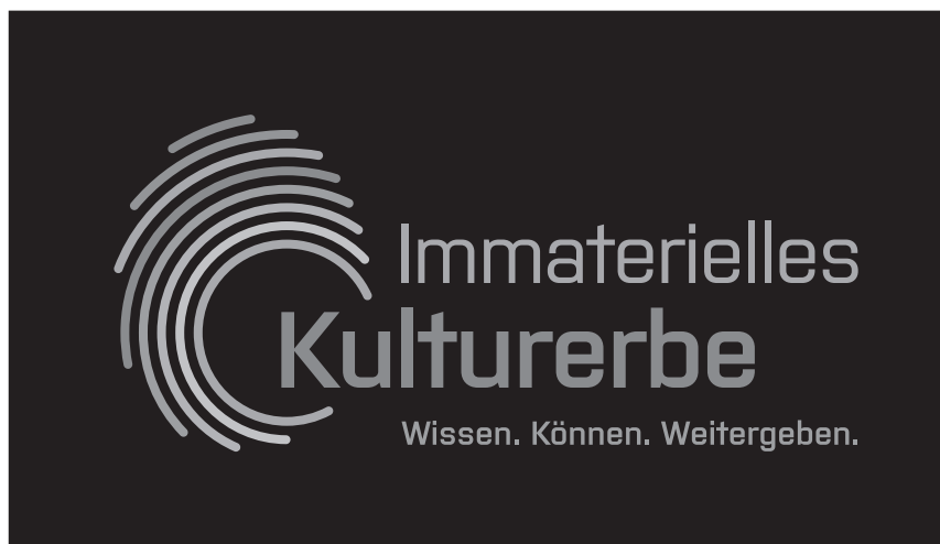
Signet Graustufen negativ